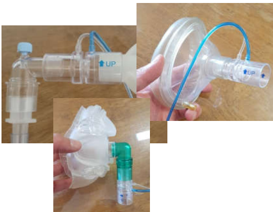
El sensor de flujo del monitor conectado a diferentes interfaces. Se puede conectar a cualquier respirador.

Por ejemplo, en Italia durante esta misma pandemia, hubo médicos dermatólogos que debían decidir cómo hacer la ventilación mecánica.